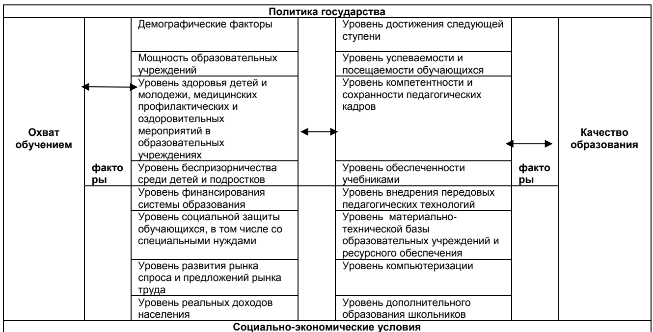
Схема 1. Факторы и условия, активно влияющие на достижение конечного результата системы образования

В первую очередь, содержание каждого показателя в области образования представляет собой сложную систему взаимосвязанных и взаимовлияющих внутренних и внешних процессов, поэтому предлагается факторы и условия, активно влияющие на процесс развития образования (Схема 1).