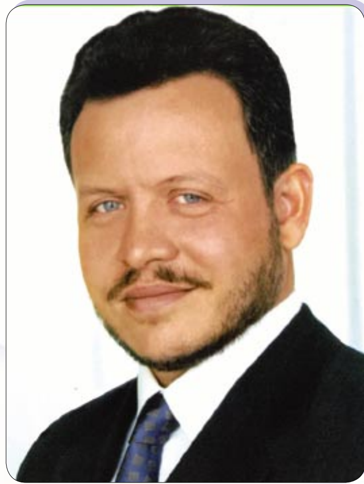
جلالة الملك عبد الله الثاني ابن الحسين المعظم