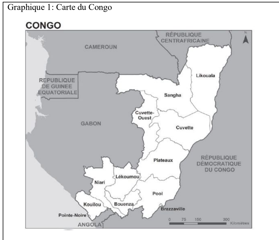
Graphique 1: Carte du Congo