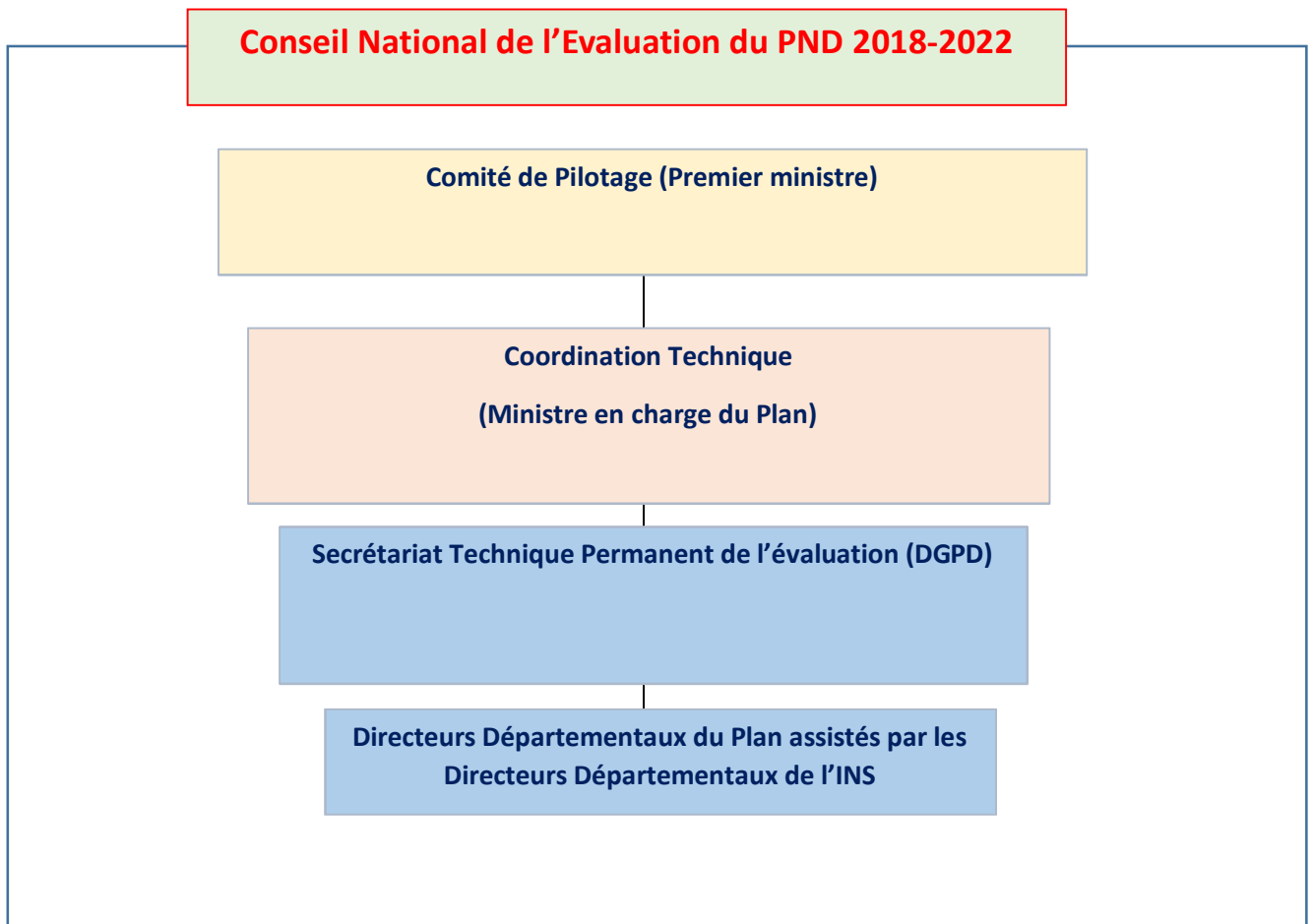
Encadré 6 : Schéma du dispositif institutionnel d'évaluation du PND 2018-2022

753. La Coordination Départementale. Elle est animée par le directeur départemental du plan appuyé par le directeur départemental de l'INS. Elle a pour mission de coordonner la réalisation d'évaluation des performances de la mise en œuvre du PND 2018 – 2022 au niveau départemental.